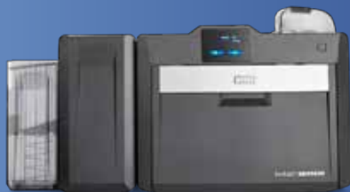
Impressora/codificadora de dupla-face

O alimentador opcional de entrada dupla para cartões aumenta a capacidade de entrada de cartões na impressora e possibilita um gerenciamento simplificado para vários tipos de cartões. Os usuários podem facilmente alternar entre tipos de cartões sem ter que descarregar e recarregar cartões – permitindo uma produtividade contínua e ininterrupta.