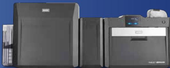
Impressora/codificadora de dupla-face com laminação opcional